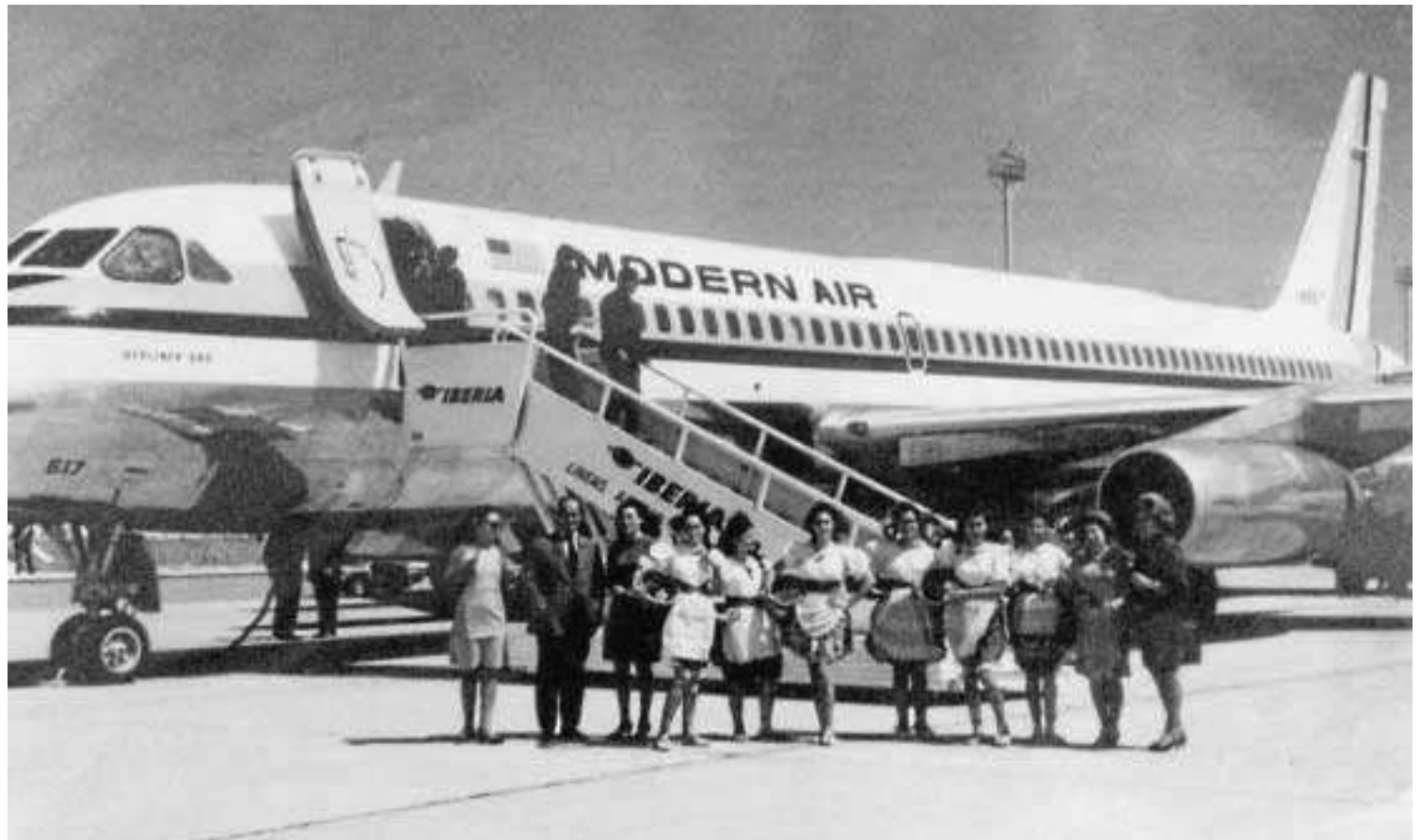
Imagen del primer avión con turistas alemanes que venían a Almería, a través de San Javier (Murcia), hace medio siglo, con el aeropuerto almeriense en construcción.

Así lo describe hoy el fundador del Grupo Hoteles Playa, que recuerda que en marzo se cumplen nada menos que 50 años desde que la empresa que preside comenzó a traer turistas ale-