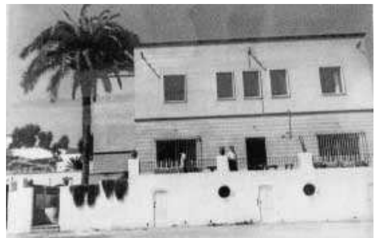
Hotel Costablanca, en Garrucha, donde se alojaban los primeros turistas.

avión procedente de Berlín (Alemania), con los primeros turistas alemanes, que aterrizó en el aeropuerto de San Javier, pues el aeródromo de Almería