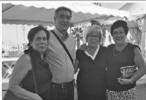
PASEOMARÍTIMO. El encuentro tuvo lugar en el Restaurante La Oficina de Garrucha.