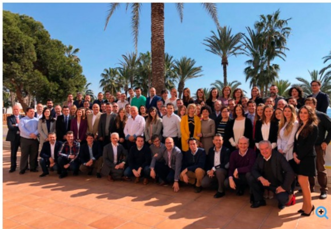
Equipo de Senator Hotels & Resorts que ha asistido a las jornadas formativas celebradas en Aguadulce.

Actualizado Martes 27/02/2018 9:30 horas