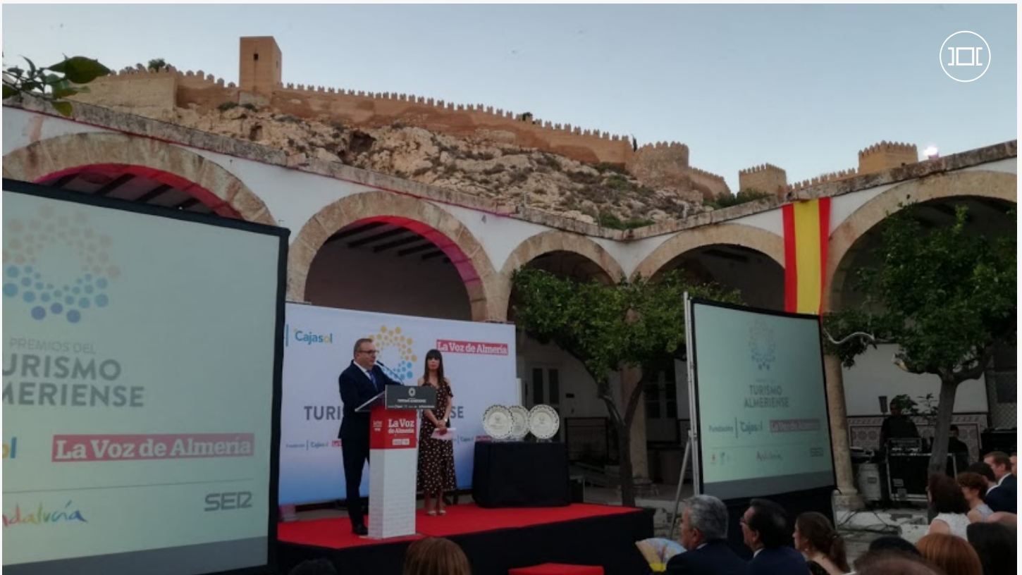
Los Premios del Turismo Almeriense, en imágenes

La gala organizada por LA VOZ y la Fundación Cajasol se celebra en el Patio de los Naranjos