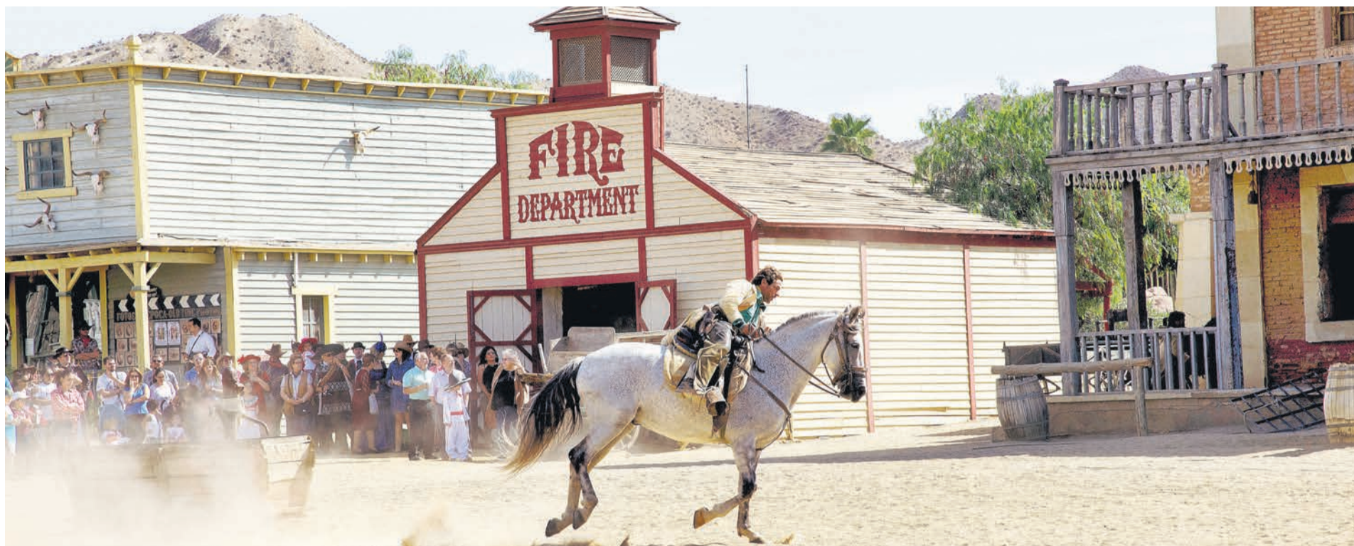
LOS ESPECTÁCULOS diarios suelen encantar al público.