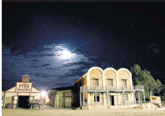
PARQUE OASYS es una experiencia única.