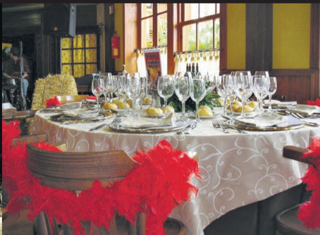
LAS CELEBRACIONES son por todo lo alto.