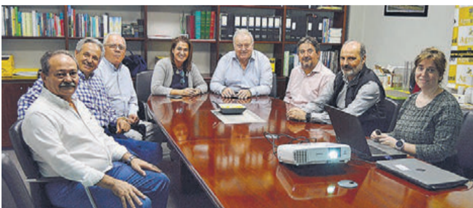
JURADO del Colegio de Economistas y directivos de Agrobío.

Biofábrica Agrobío es una biofábrica que produce fauna auxiliar para combatir las plagas y abejorros para la polinización natural. Fundada en 1995 en Almería, fue pionera en la producción de abejorros en España. Su trayectoria y si-